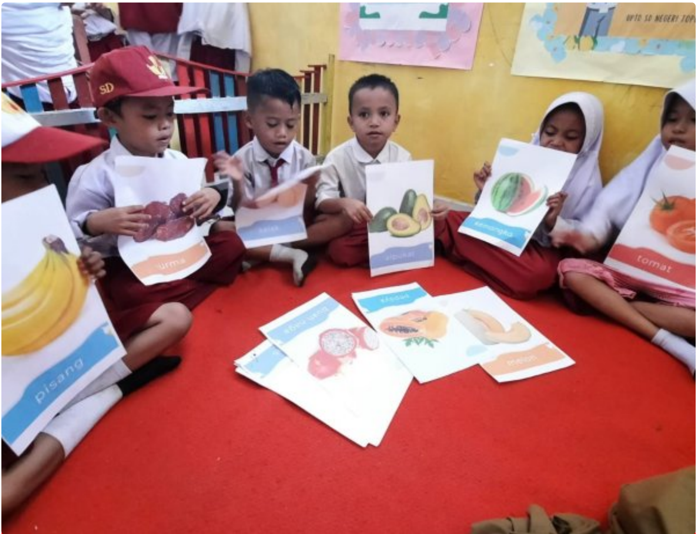
Siswa-Siswi Terlihat Antusias Belajar Dengan Adanya Gambar Yang Berwarna-warni

Mamuju Tengah – Pendidikan mempunyai perang penting dalam pembentukan karakter keterampilan dan pengetahuan peserta didik, sala satu hal yang penting dalam pendidikan adalah literasi kemampuan membaca, menulis dan berhitung.